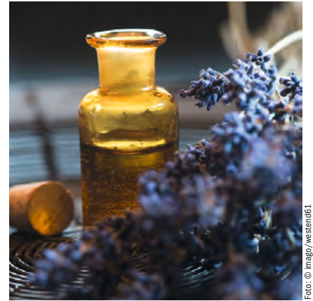
Vanille für das Wohlbefinden